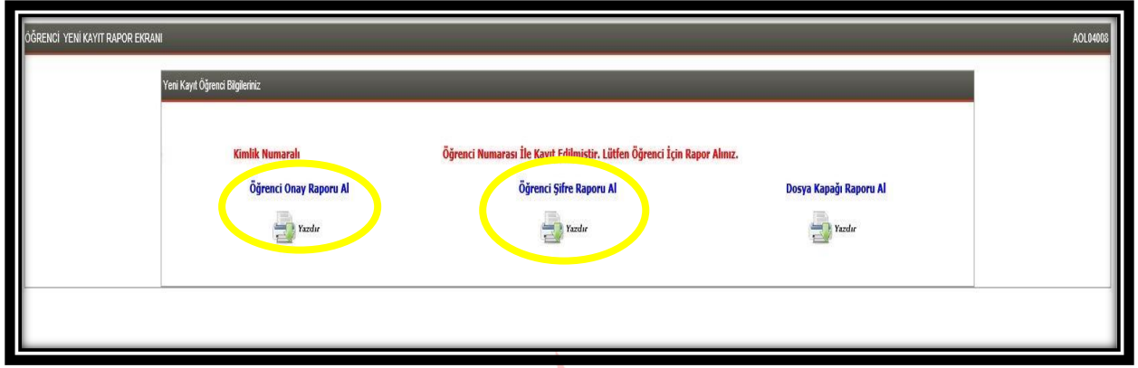
Şekil – 6

Öğrenci bu raporlarda yer alan öğrenci numarası ve şifresi ile sisteme giriş yapar, derslerini seçer, sınava gireceği yeri öğrenir ve her türlü iş ve işlemlerini yürütür.