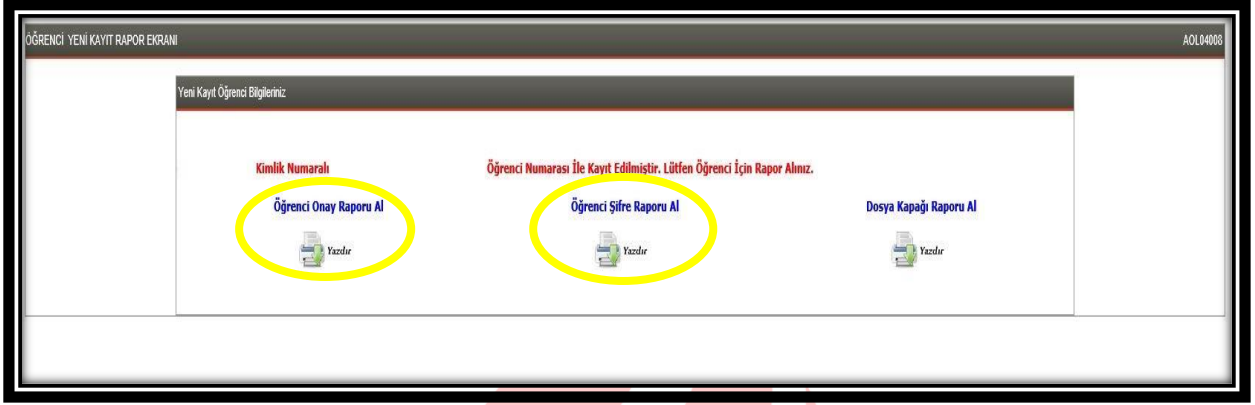
Şekil – 8

Öğrenci bu raporlarda yer alan öğrenci numarası ve şifresi ile sisteme giriş yapar, derslerini seçer, sınava gireceği yeri öğrenir ve her türlü iş ve işlemlerini yürütür.