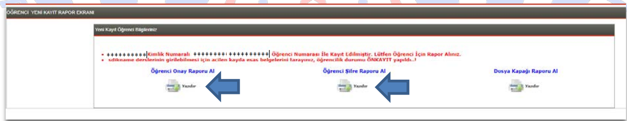
Şekil – 6

Daha sonra yine “Yazdır” butonuna basılarak “Öğrenci Şifre Raporu AI” seçeneği tıklanır. Çıktı alınarak öğrenciye verilir. (Şekil – 6)