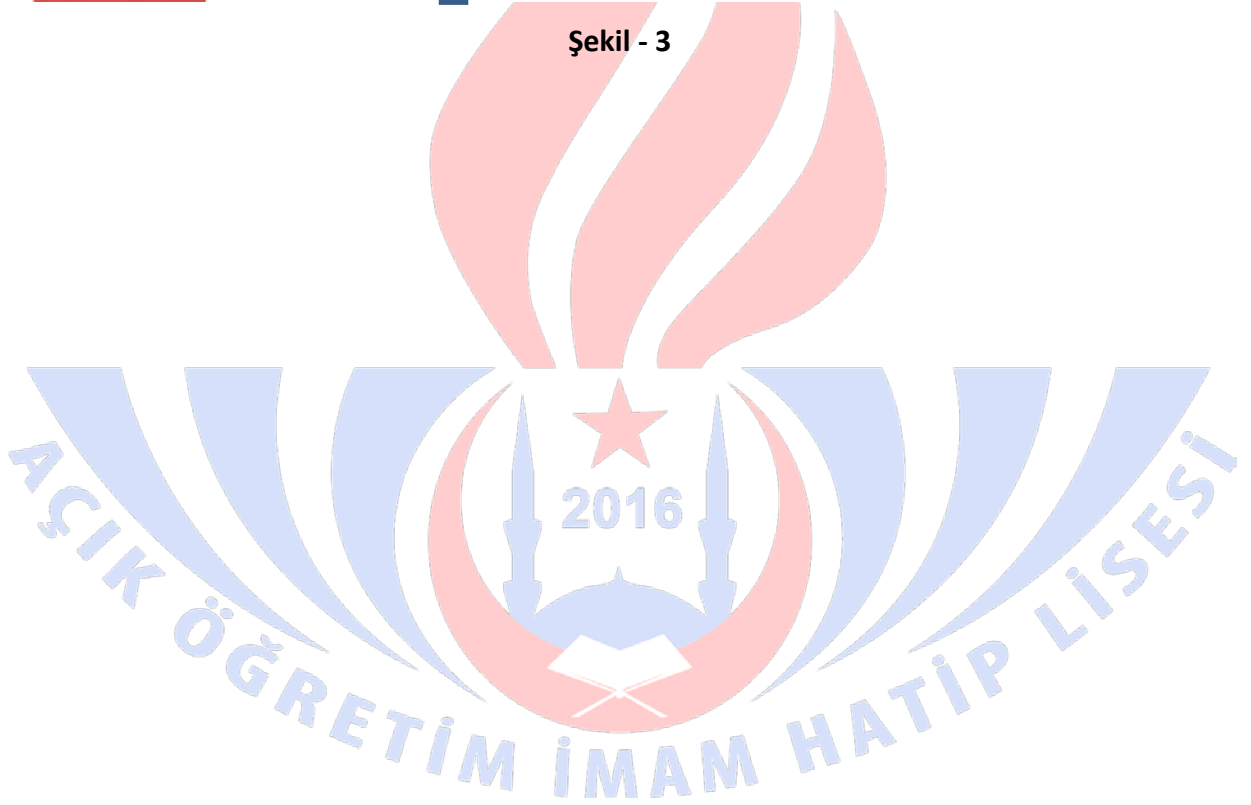
Şekil - 3